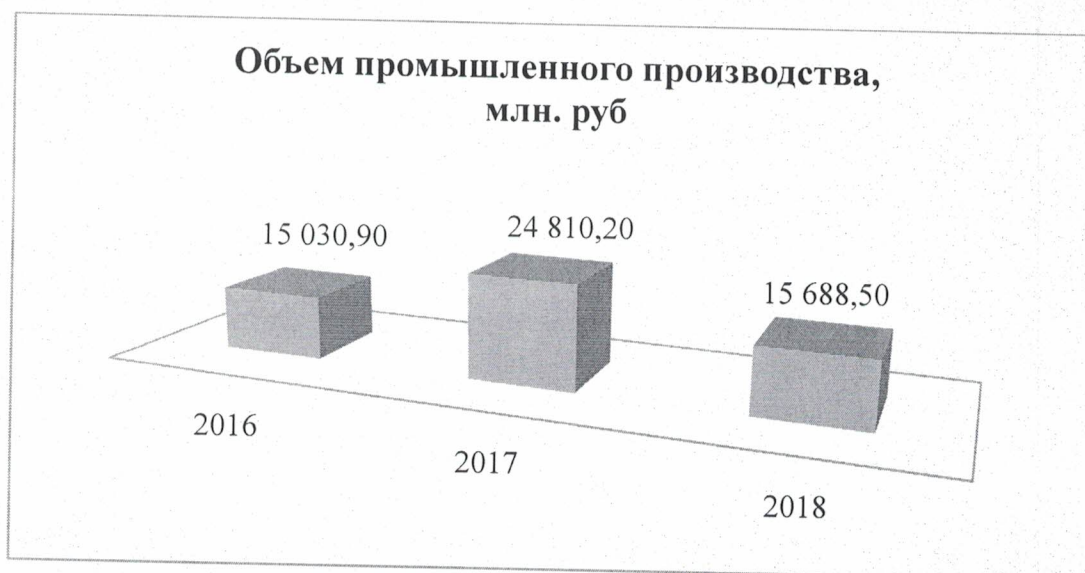
Объем промышленного производства по видам отраслей за 2018 г.

Определяющее влияние на динамику развития промышленного комплекса оказывает развитие добывающей отрасли, удельный вес в общем объеме отгруженных товаров собственного производства в котором составляет 74 процента, 25 процентов приходится на производство и распределение электроэнергии, газа и воды и 1 процент - обрабатывающие производства.