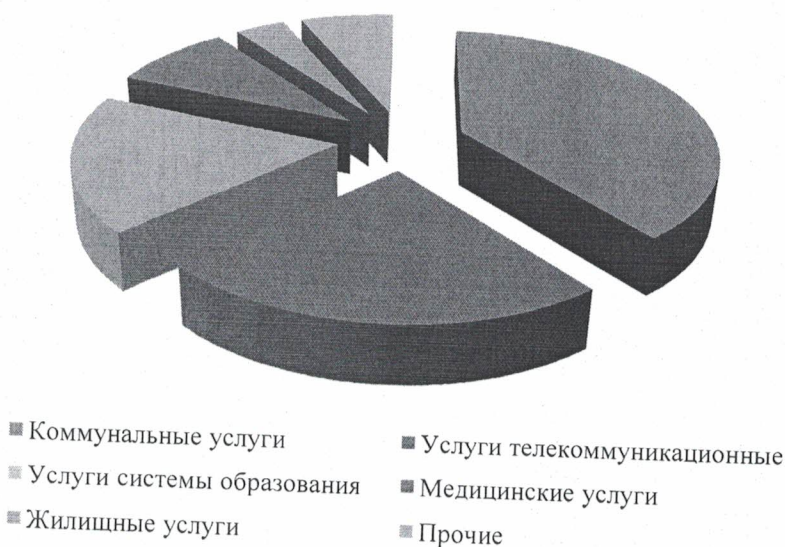
Структура платных услуг населению по видам в 2018 году

В целях реагирования на повышение цен на социально значимые товары Мэрия г. Кызыла проводит регулярный мониторинг цен. Индекс потребительских цен в декабре 2018 года к декабрю 2017 года составил 104,3 процента, в том числе на продовольственные товары – 103,8 процентов, непродовольственные – 105,6 процентов, услуги – 103,0 процента. В связи с ростом потребительских цен и со снижением реальных располагаемых денежных доходов населения на 13,4 процента покупательская способность населения снизилась.